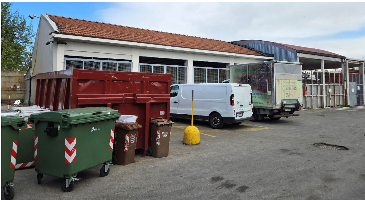
Fabbricato C – vista da Sud-Ovest