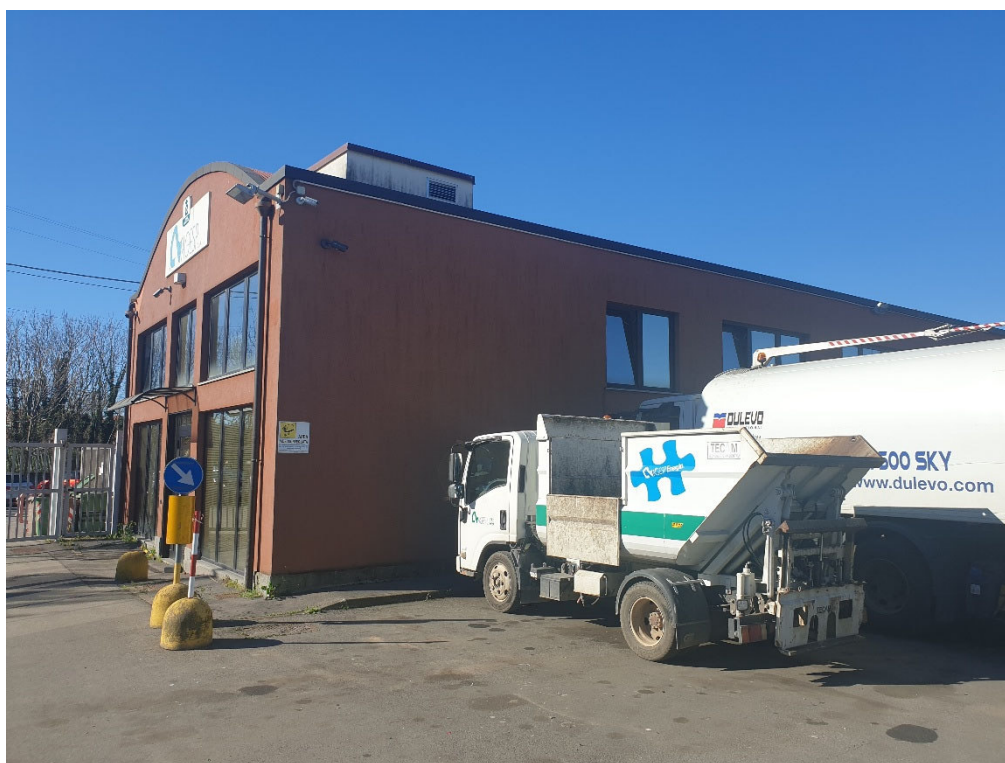
Foto 1: Vista edificio esistente nella zona in cui verrà posizionato il blocco 1 dei nuovi spogliatoi

Attualmente il cortile della sede di via Canale 26 viene utilizzato come parcheggio dei mezzi di AGESP Ambiente per il Territorio. La finitura dell'edificio vicino al quale verrà posizionato il blocco 1 degli spogliatoi è in intonaco color mattone e i serramenti sono color testa di moro (vedi foto 1). Il blocco 2 degli spogliatoi verrà posizionato su una platea esistente davanti a una siepe (vedi foto 2)