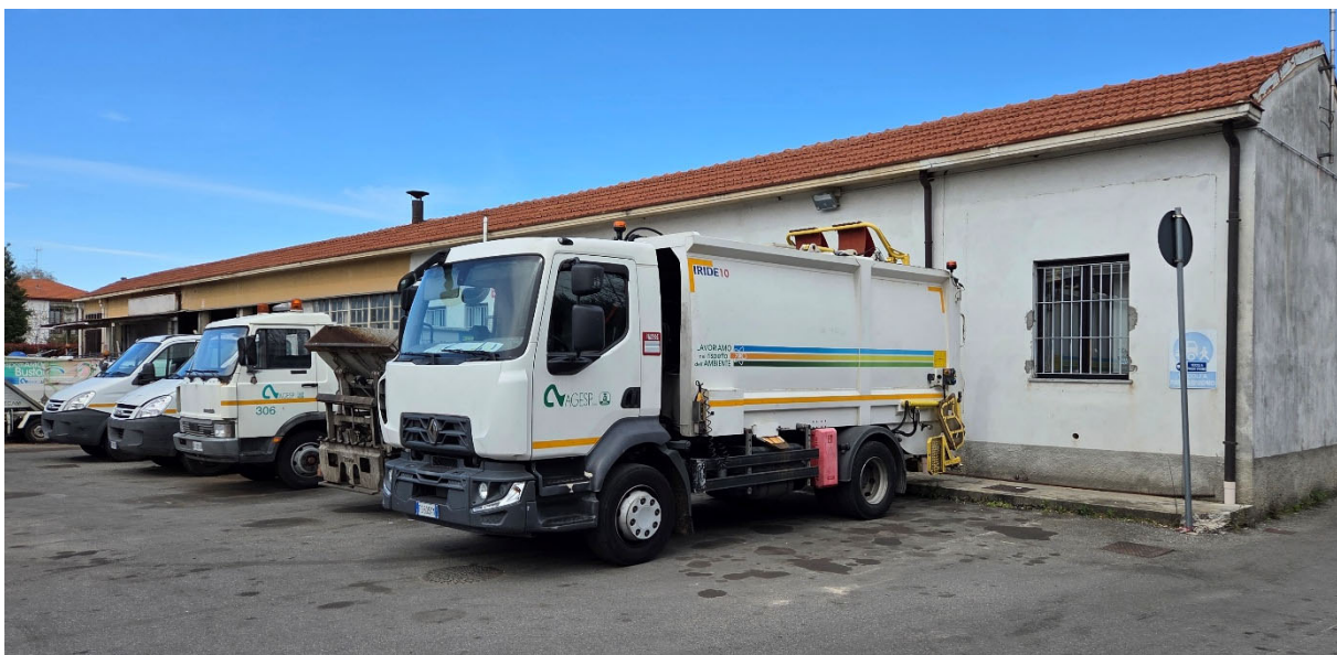
Fabbricato B – vista da Sud-Est