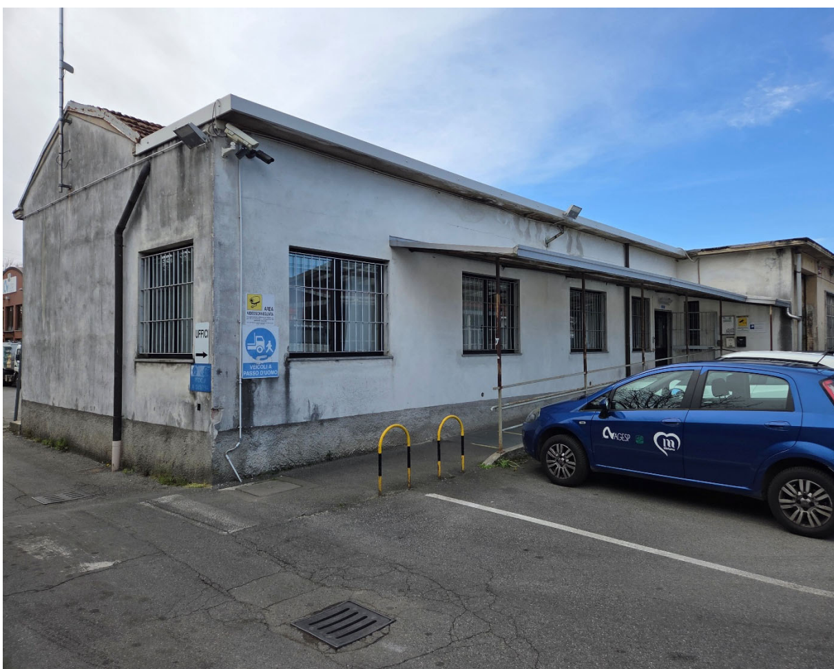
Fabbricato B – vista da Nord-Est