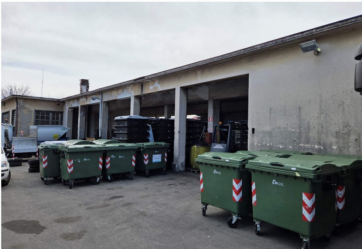
Fabbricato B – vista da Nord-Ovest