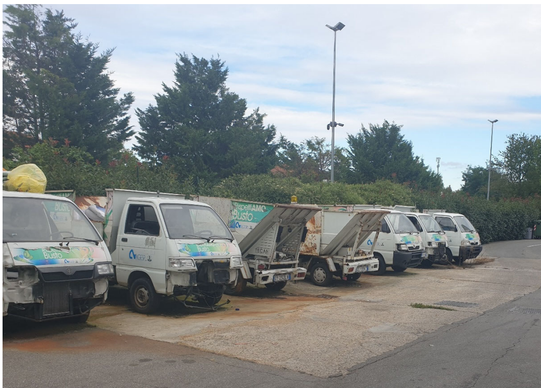
Foto 2: Zona in cui verrà posizionato il blocco 2 spogliatoi dei nuovi spogliatoi