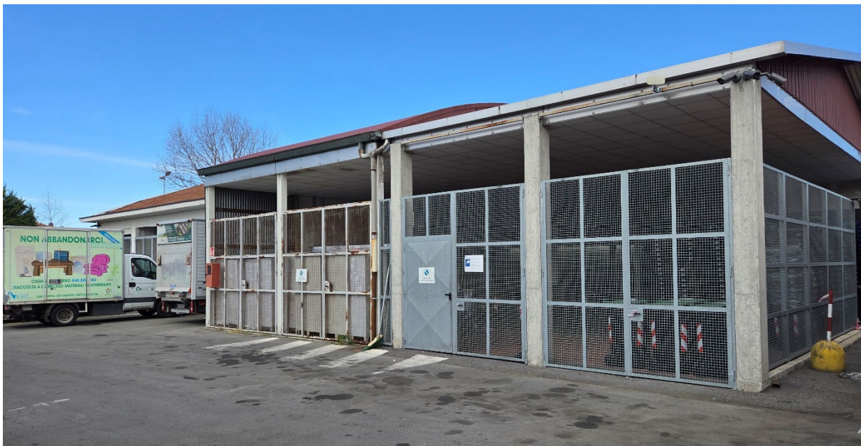
Fabbricato C – vista da Sud-Est

In assenza di uniformità si è optato per assimilare il più possibile l'estetica dei prefabbricati all'edificio più vicino.